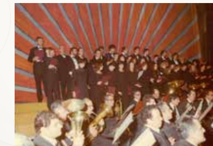
Concerto di Natale 1976