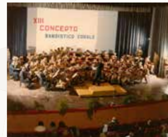
Concerto di Natale 1979