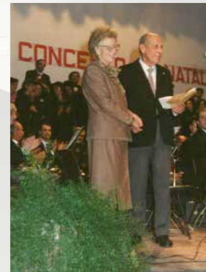
Concerto di Natale 1990 - Magda Olivero