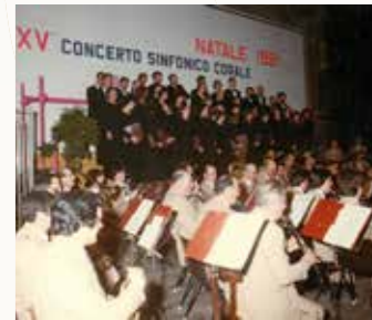
Concerto di Natale 1981