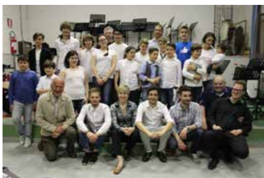
Saggio degli allievi anno 2015/16

Gli incontri musicali sono aperti a tutti i ragazzi che studiano uno strumento da banda. Ti aspettiamo!