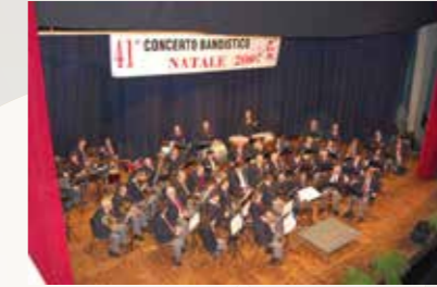
Concerto di Natale 2007