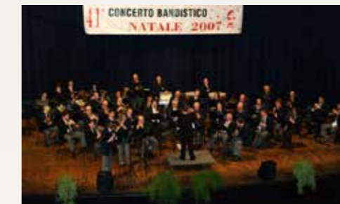
Concerto di Natale 2007