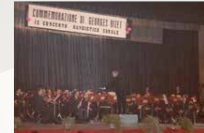
Concerto di Natale 1975