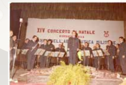
Concerto di Natale 1980 «Banda dell'Aeronautica Militare»