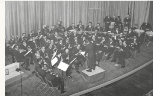
1° Concerto di Natale 1967