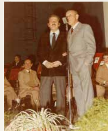
Concerto di Natale 1984 - Domenico Modugno