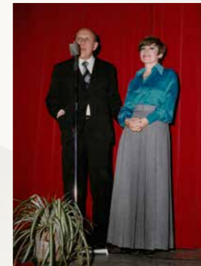
Concerto di Natale 1975 - Franca Valeri