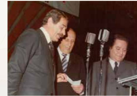
Concerto di Natale 1976 - Nipoti di Mascagni